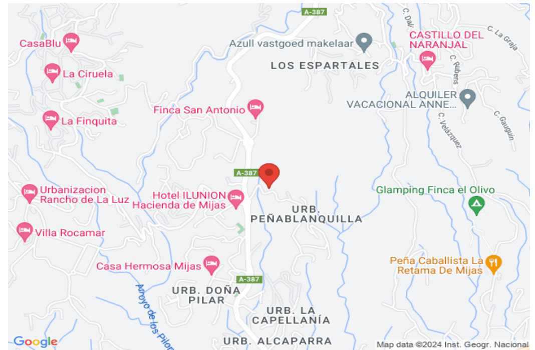
Map data ©2024 Inst. Geogr. Nacional